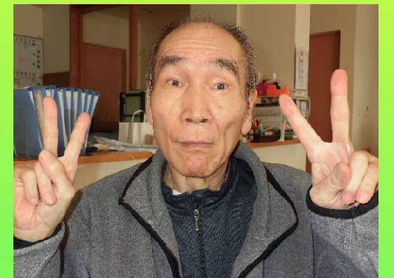
〇〇 〇〇 様 S XX・XX・XX