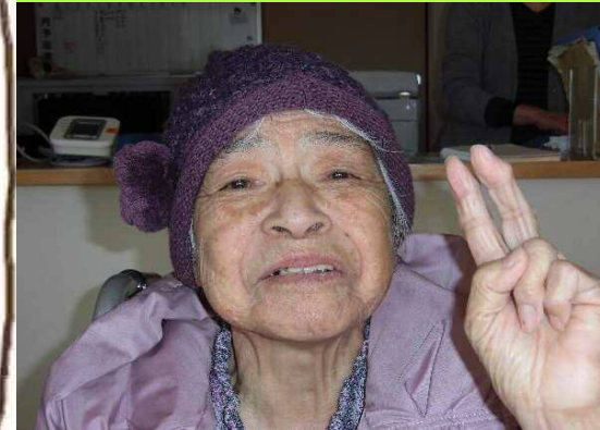
〇〇 〇〇 様 T XX・XX・XX