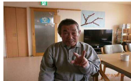
〇〇 〇〇 様 SXX・XX・XX 6