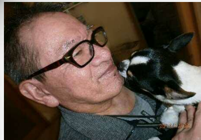
〇〇 〇〇 様 SXX・XX・XX