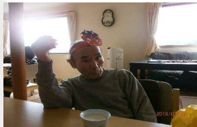
〇〇 〇〇 様 SXX・XX・XX