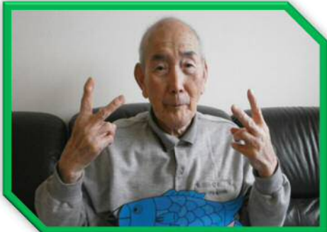
〇〇 〇〇さん (94歳) T11・3月10日