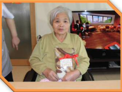
〇〇 〇〇さん (82歳) S8年・4月20日