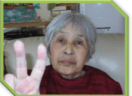
〇〇 〇〇さん (80歳) S10年・4月22日