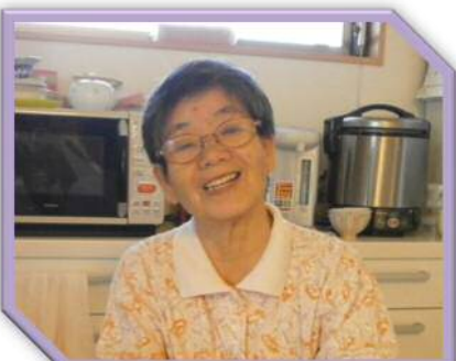
〇〇 〇〇さん (80歳) S11・3月18日