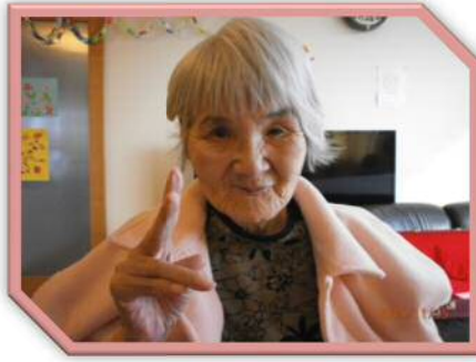
〇〇 〇〇さん (88歳) S3年・4月10日