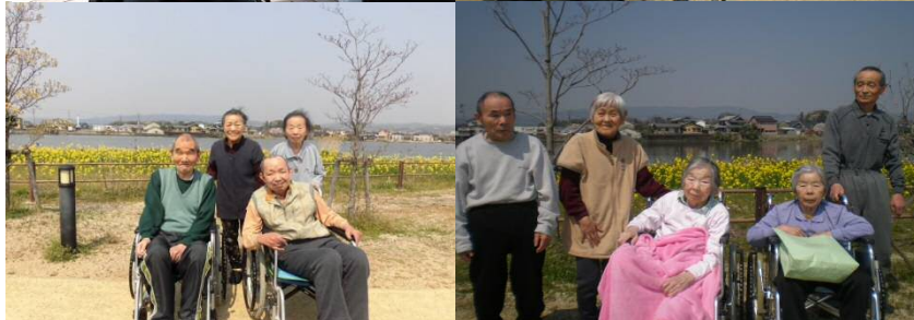
2日に分けてお花見へ！いい思い出になりました♡