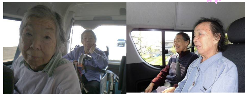
道中も花がいっぱいありました！