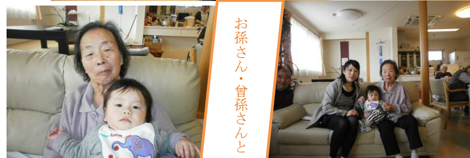
お孫さん・曾孫さんと