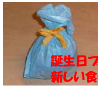
誕生日プレゼントにコップと茶碗と汁椀をいただきました。 新しい食器で食事もますます進みますね～。