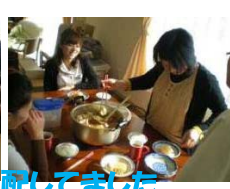
おでん作りのお手伝いをしました。きちんと味が染むか心配してました。