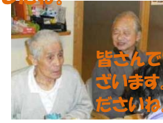
皆さんで79歳のお祝いです。おめでとうございます。 これからも、元気に長生きしてく ださいね。