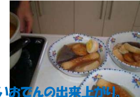
おでんパーティーをして温まりました。おいしいおでんの出来上がり。