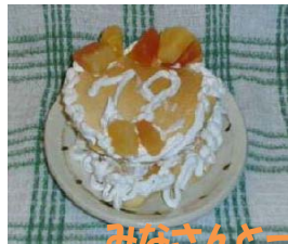
みなさんと一緒に手作りのケーキを 召し上がりました。あ～おいしい～。