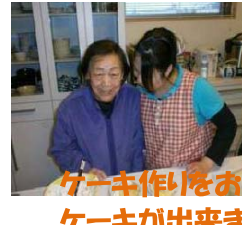
ケーキ作りをお手伝いして下さり、おいしい ケーキが出来ましたね。皆さんのおかげで おいしいケーキになりましたね。